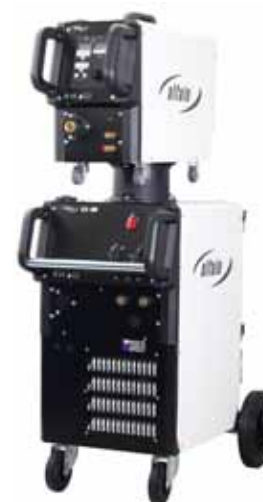
varianta se snímatelným posuvem drátu version with separate welding

Compact or with separate feeding welding machine Water cooled Welds steel, high alloyed steels and aluminium. Copper transformer 2x10 voltage steps (ATA 400 AXE) 3x10 voltage steps (ATA 500 AXE) For max. 18 kg spools Standard is 4 rolls wire feeder dia 40 mm, driven upper roll Wire feeder cover with hinges Torch EURO connector Crane eyes on request Built in cooling unit Gas pre-heating