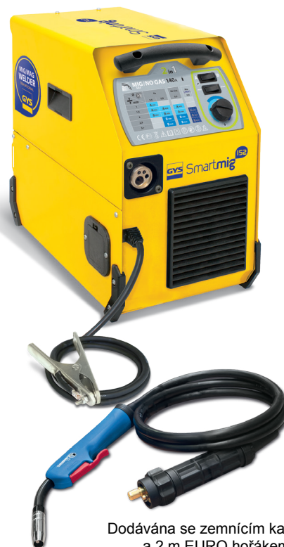
Dodávána se zemnicím kabelem a 2 m EURO hořákem

Konstantní chod ventilátoru chrání přístroj před přehřátím.