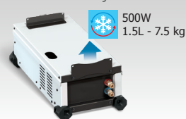
WCU 0.5kW A 039490