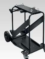
Vozík 10m 3 039711