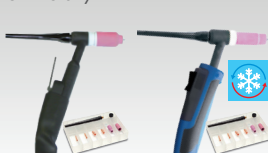
SR26 L 046184 SR20 DB 046146